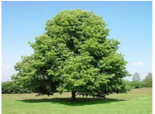
Tilleul des bois

Nectar : 3 Pollen : 2 Couleur pollen : orangé